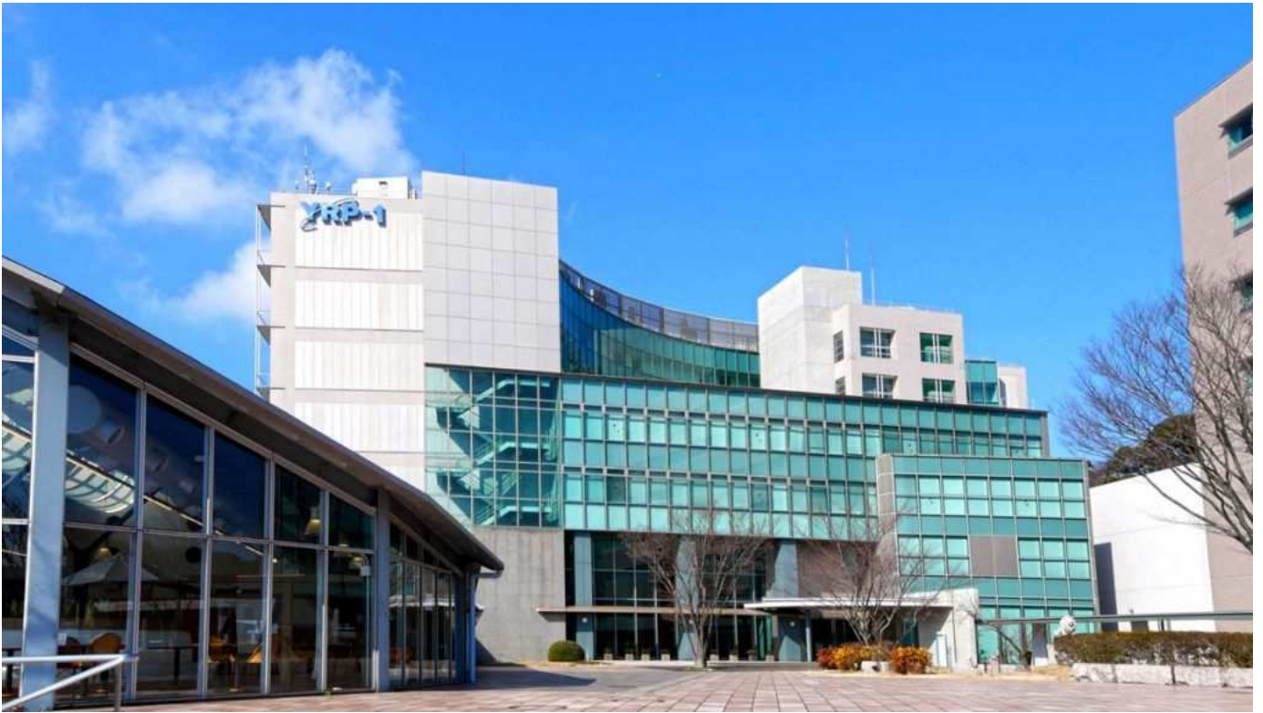
当社が運営管理するYRPセンター1番館