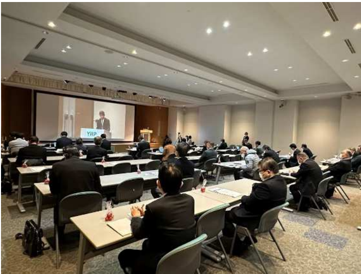
YRPちょっと最新セミナーの様子 @YRPセンター1番館 YRPホール