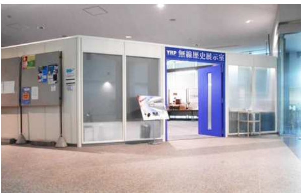
総合的な学習の一環としてYRP見学 をする地元中学生の様子 @YRPセンター1番館 無線歴史展示室